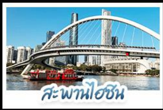
สะพานไอซิน

บินตรงดวงใจ • จัดเต็มเที่ยวสวนสนุกกลางหลงเต็มวัน เที่ยวจีนฟิลยุโรป ชมสถาปัตยกรรม ณ เกาะซาเมียน สักการะวัดพระใหญ่ พுகุรูปเก่าแก่กว่า 1,000 ปี ใจกลางเมืองกวางโจว เช็กอินกับแลนด์มาร์กสุดฮิตจัดรีฮวงเจิงท่าฮอปกับหอทีวี ฮอปโปงเพลิน ถนนคนเดินอีโต้และถนนคนเดินปักกิ่ง