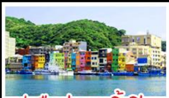
ทำเรือประมงเจิ้งปิ่น

รถไฟสายโบราณอาลีซาน - ตักไทเป 101 ประมงเจิ้งปิ่น - จิวเฟิ่น - ล่องเรือทะเลสาบสุริยันจันทรา ถนนเมบูเค็ด เสี่ยวหลงเป่า & ปลายประธาราธิบดี ฮ่องกง 3 ย่านดัง : ซีเหมินดิง - ไถจงไนท์มาร์เก็ต - MITSUI OUTLET