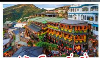
หมู่บ้านโบราณจิ่วเฟิ่น