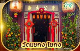
วัดเขกง ไชกง