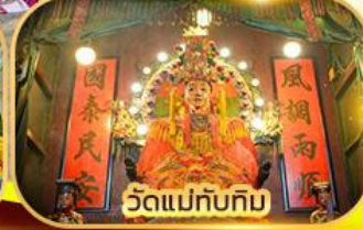
วัดแม่ทับทิม