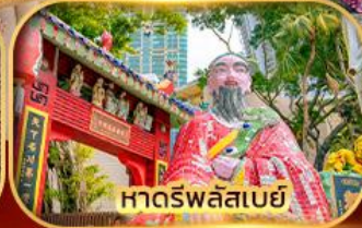
หาดร์พลัสเบย์