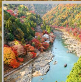
"ARASHIYAMA MT. KAMEYAMA"