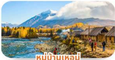
หมู่บ้านเหมอู๋