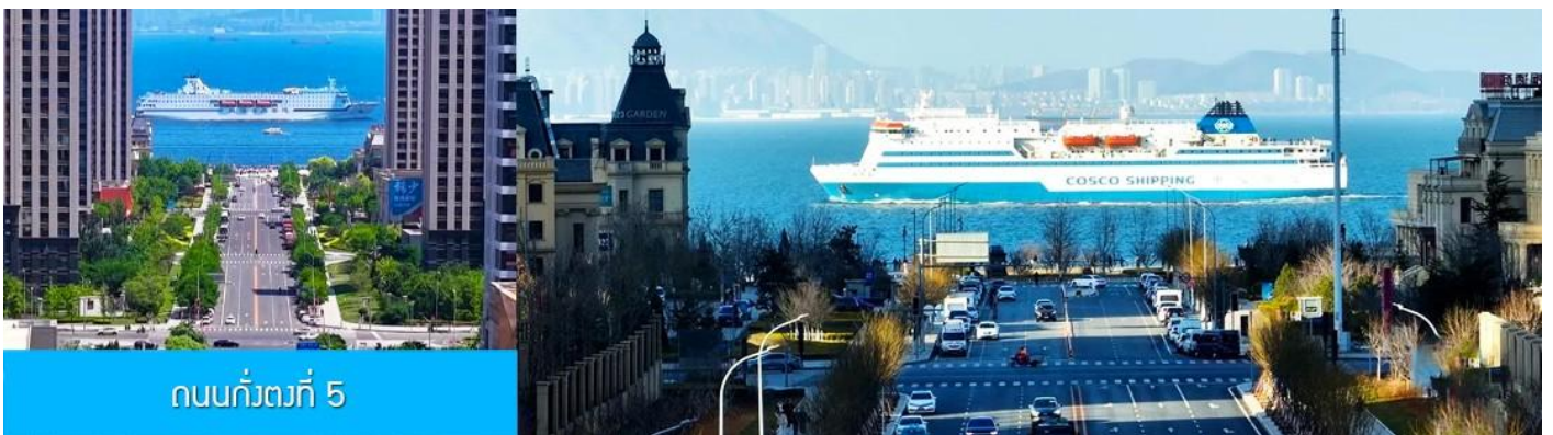
ถนนกว้างที่ 5

จากนั้นนำท่านเที่ยวชม สวนน้ำเมืองเวนิสตะวันออก 大连东方威尼斯城 เป็นเมืองเวนิสจำลองที่ถูกสร้างขึ้นด้วยทุนกว่า 8,000 ล้านดอลลาร์ ออกแบบโดยบริษัท ARC จากประเทศฝรั่งเศส โดยจำลองผังเมืองเวนิสในประเทศอิตาลี บนพื้นที่กว่า 400,000 ตารางเมตร ประกอบด้วยคลองเวนิสและอาคารที่มีสถาปัตยกรรมแบบตะวันตกกว่า 200 หลัง มีบริการล่องเรือคอนโดล่าแก่นักท่องเที่ยว นำท่านเดินชม ถ่ายภาพที่ระลึกท่ามกลาง