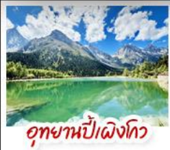
อุทยานปี่เฉิงโกว

มรดกโลกพระพุทธรูปแกะสลักหินต้าวู้ - อุทยานหลุมบ่อฟ้าสะพานสวรรค์ อุทยานเขานางฟ้า - หงหยาดัง - ดิกยูชิง ชั้น 22 - ชมรถไฟรถไฟฟ้าทะลุค สะพานโบราณหนานเฉียว - เมืองโบราณกวนเซี่ยน - อุทยานภูเขาสี่ดรุณี อุทยานปี่เฉิงโกว - ถนนโบราณชอยกวางชอยแคบ - วัดต้าอื่อ ถนนคนเดินซุนซีลู่ - หมู่เพนด้าปิ่นตักIFS - ถนนไท่กุ่หลี่