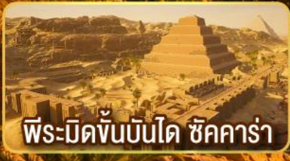
พีระมิดขั้นบันได ชิคคาร์่า