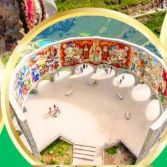
Russian-Georgian Friendship Monument