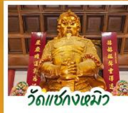
วัดเซกตงหิว