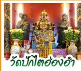
วัดปึกโตย่องฮา